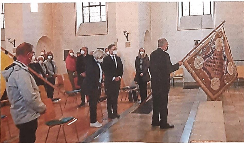
Die kirchlichen Verbände nahmen mit ihren Bannern Abschied von der Marienkirche.

Nach dem Gottesdienst waren die Besucher zu Begegnung, Gesprächen und einem Imbiss am Pfarrheim Haus Ludwig eingeladen. In der Kirche war den ganzen Tag über Gelegenheit, vor der Marienstatue Kerzen anzuzünden und noch einmal zurückzudenken an schöne oder auch schmerzliche Momente, die Menschen mit dieser Kirche verbinden.