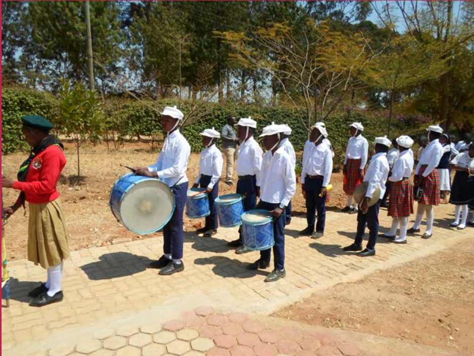
Auch die Instrumente des Schulorchesters wurden von unserer Gemeinde mitfinanziert.

Auch in der schwierigen Coronazeit läuft der Schulbetrieb an der Partnerschule unserer Gemeinde, der St. Charles Grundschule in Iringa, im Landesinnern von Tansania in Ostafrika, jetzt wieder mit vollem Programm, nachdem im letzten und vorletzten Jahr die Schule mehrere Monate wegen der Pandemie geschlossen war. Für die Schule ein doppeltes Problem: Die Schüler/innen mussten lange auf den Unterricht einschließlich der