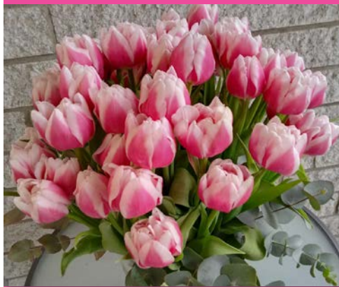
Ein kleiner Ostergruß von Ihrer kfd.

Für das neue Jahr ist leider nicht möglich, ein neues Programm auszuarbeiten. Sobald das Coronavirus eine gewisse Planungssicherheit gibt, werden die Veranstaltungen in der Tagespresse veröffentlicht.