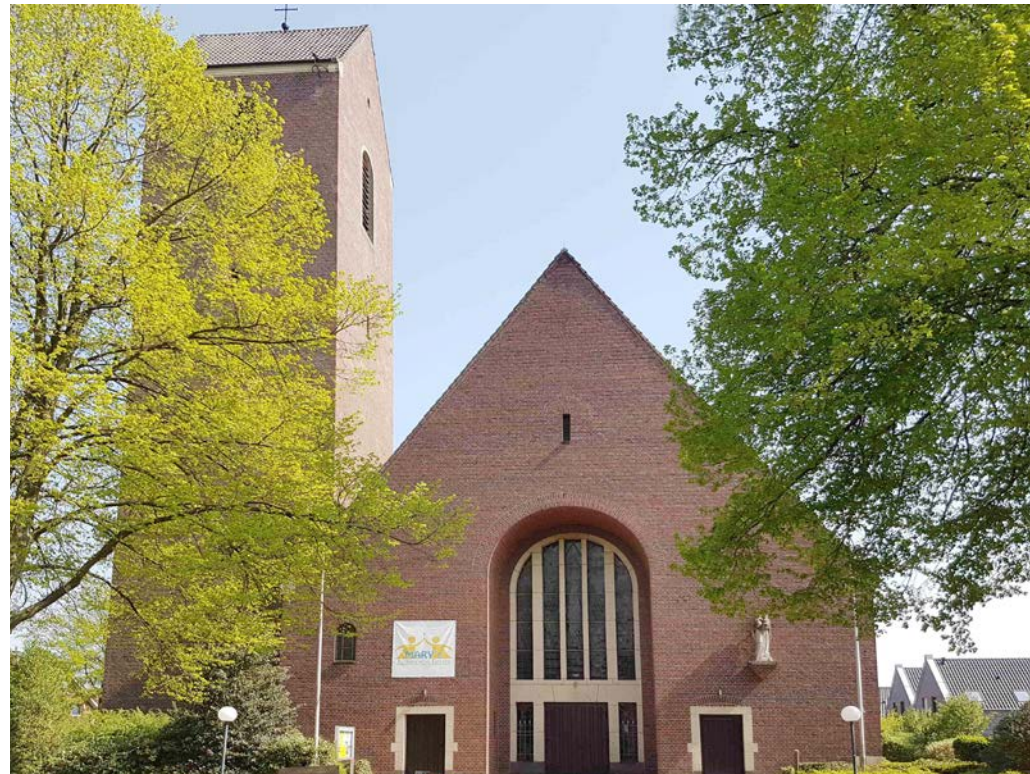
Abschied nehmen von der Marienkirche.