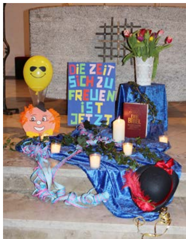
Motto des Karnevals der kfd St. Franziskus

Seit 1981 feiern die Frauen der kfd St. Franziskus Karneval. Traditionell in einer Sitzung feiern über 100 Frauen gemeinsam ein wunderschönes Fest.