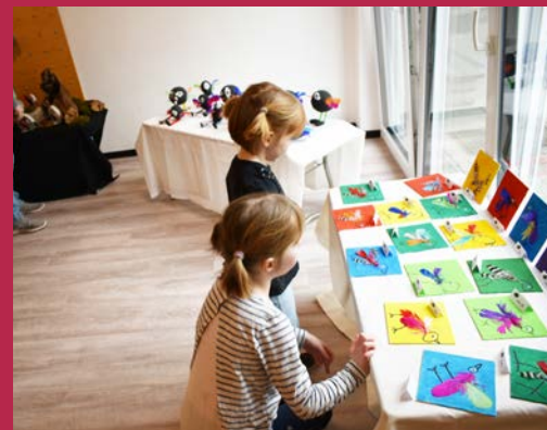
Vernissage in der Kita St. Johannes