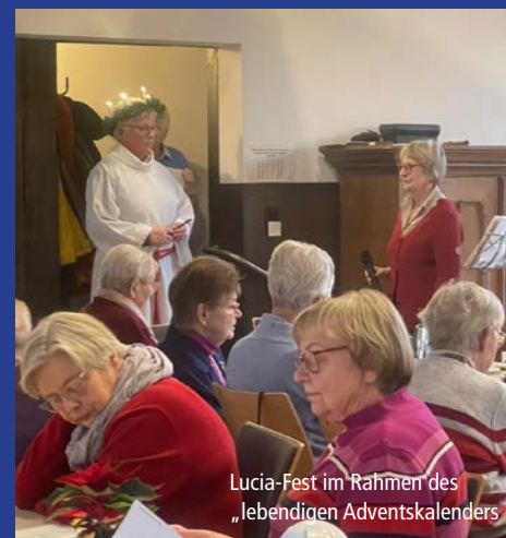
Lucia-Fest im Rahmen des „lebendigen Adventskalenders“