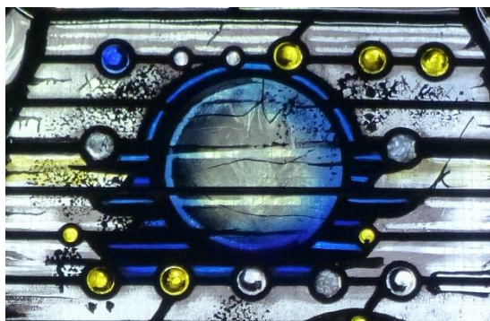
(Detail aus einem Fenster der Franziskuskirche, Reckenfeld)